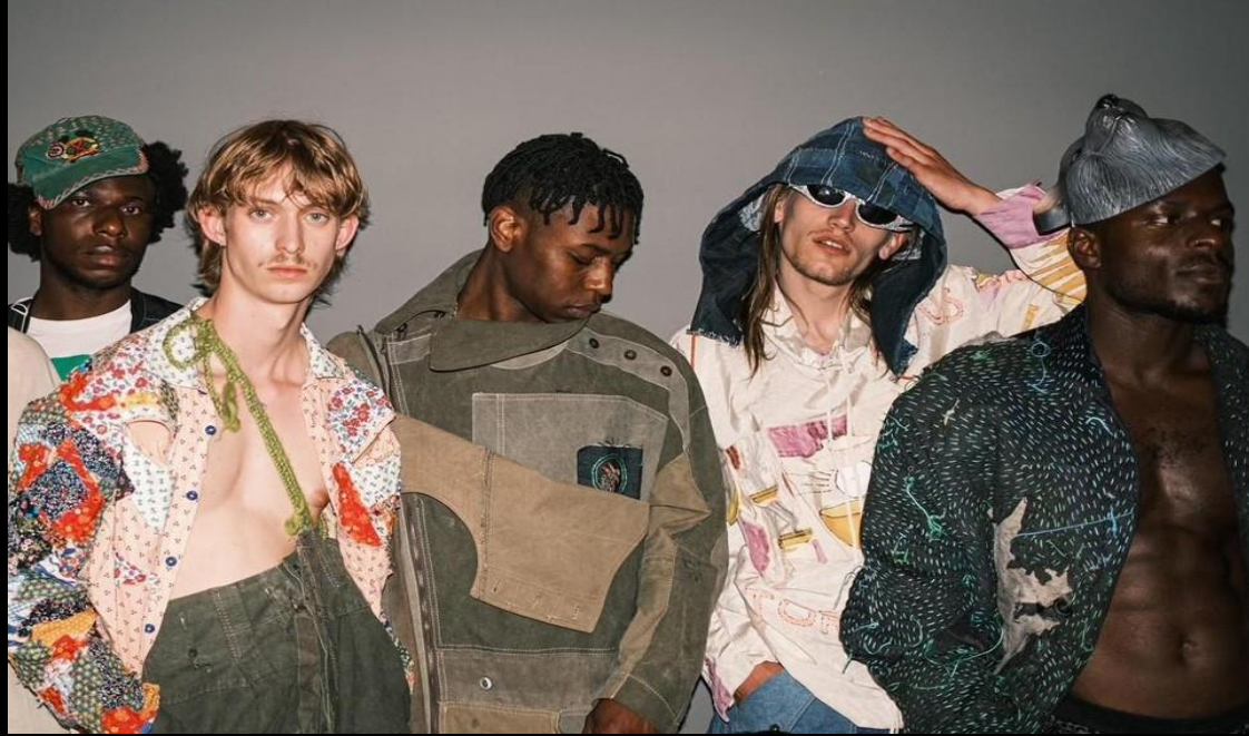
Fashionclash, Wyck, Ceramique