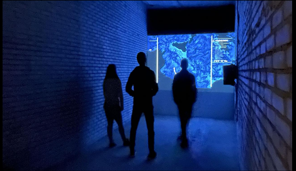
No Access, Cannerberg