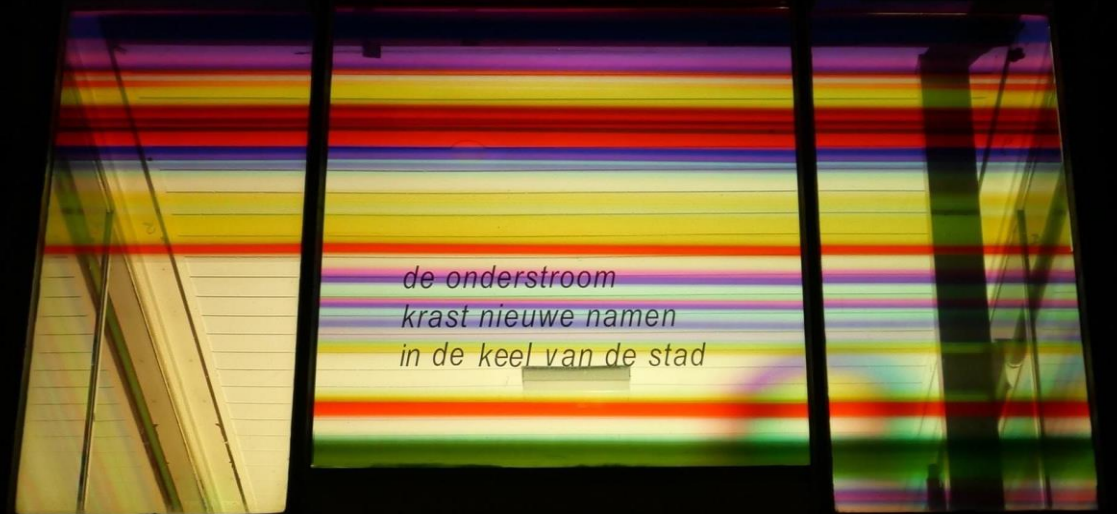
Spot on!, St. Servaasbrug