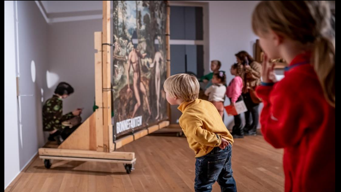
Free Fridays, Bonnefanten