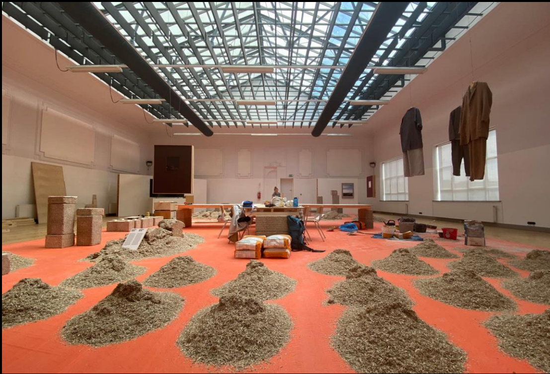
Bureau Europa, Architectuur